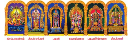
திருப்புகழைத் திருப்பந்தூர் பூசம் கவசம் பழமுதிர்வை திருத்தல்

இந்த ஆண்டு தை பூசமும் பெளர்ணமியும் ஒன்று சேர வரவில்லை. ஆயினும் பூசம் நட்சத்திரம் மாலை வரை இருக்கும் 17.1.2014 வெள்ளி அன்றே தைப்பூசம் வழிபடுவது நன்று. மலேசியா, சிங்கப்பூர் பொருத்த மட்டில் 17.1.2014 வெள்ளி அன்று தான் தைப்பூசம்.