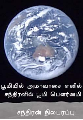
பூமியில் அமாவாசை எனில் சந்திரனில் பூமி பெளர்ணமி சந்திரன் நிலபரப்பு

அமாவாசையின் குறைந்த பட்ச அதிக பட்ச கால அளவு: 19 மணி 59 நிமிடம் முதல் 26 மணி 47 நிமிடம் வரை இருக்கும்